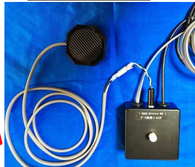
サイズ : W80xH40xD80 スイッチケーブル除く